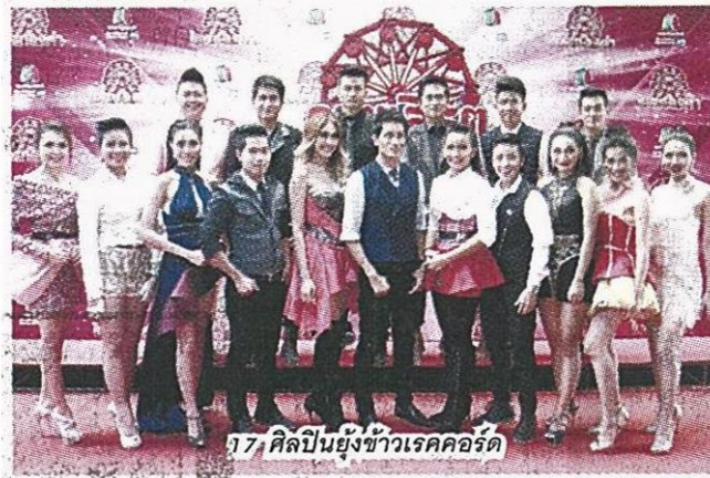
17 ศิลปินยังชั่วเรคคอร์ด