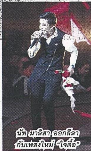
นนท์ มาลีสา ออกลิลา กับเพลงใหม่ "ใจคือ"