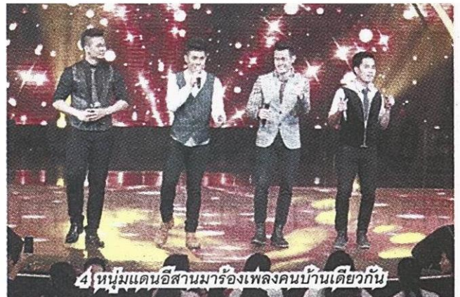
4 หนุ่มแดนอีสานมาร้องเพลงคนบ้านเดียวกัน