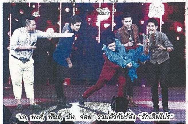
"เอ, พงค์, พันธ์, นนท์, จอย" รวมตัวกันร้อง "รักเต็มไปไร่"