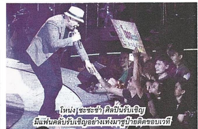
โหน่ง สะระซ่า ศิลปินรับเชิญ มีแฟนคลับรับเชิญอย่างเต็มที่มาซูบ้ายติดขอบเวที

บุกขึ้นไปบนเวทีที่คลั่งพวงมาลัยหอมแก้มฟอดใหญ่โจ้วแฟน ๆ อีกต่างหาก ทำให้บรรยากาศที่สนุกสนานอยู่แล้วยิ่งสนุกกว่าเดิมหลายเท่าตัว ความสนุกสนานยังคงต่อเนื่องด้วยเพลงจังหวะสนุก ๆ ของ บีม ศศิธร กับ "โสดเมื่อไหร่ค่อยไลน์มา", เฟิร์น ชนิศรา กับ "โนบราโนราห์", 3 สาว โบเฟอร์น-ออย-บีม ที่มาใน "เลิกแล้วคะ" และปิดท้ายการถ่ายทอดสดด้วย นัท มาลีสา กับเพลงใหม่ "ใจดี" คอนเสิร์ตยังดำเนินต่อไปกับศิลปินที่ผลัดเปลี่ยนหมุนเวียนขึ้น