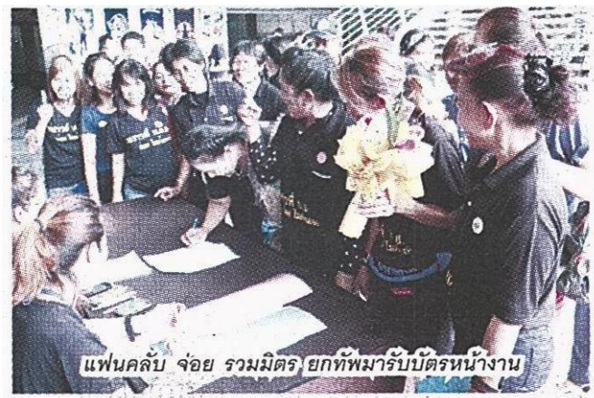
แฟนคลับ จ้อย รวมมิตร ยกทัพมารับบัตรพนักงาน