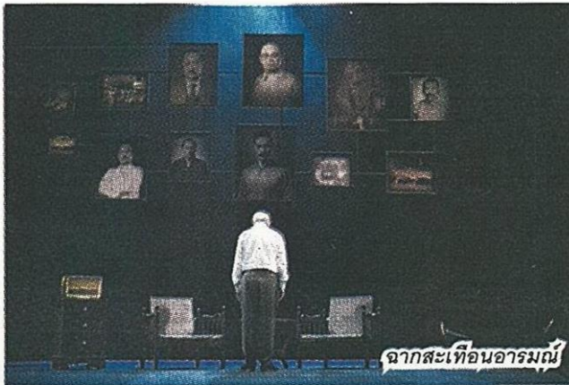
จากสะท้อนอารมณ์