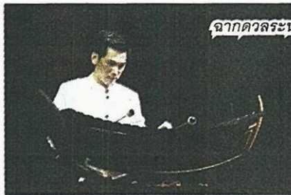
ฉากตัวละครขนาดเชือดเฉือน